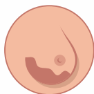
alteração da cor, espessura ou textura da pele de uma mama