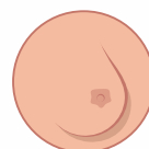
retração ou alteração de posição ou forma de um mamilo