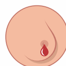
secreção ou perda de líquido pelo mamilo