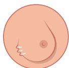
Retração da pele