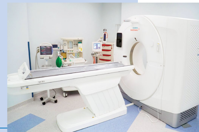
Equipamentos de última geração estão disponíveis no novo Centro de Medicina Diagnóstica