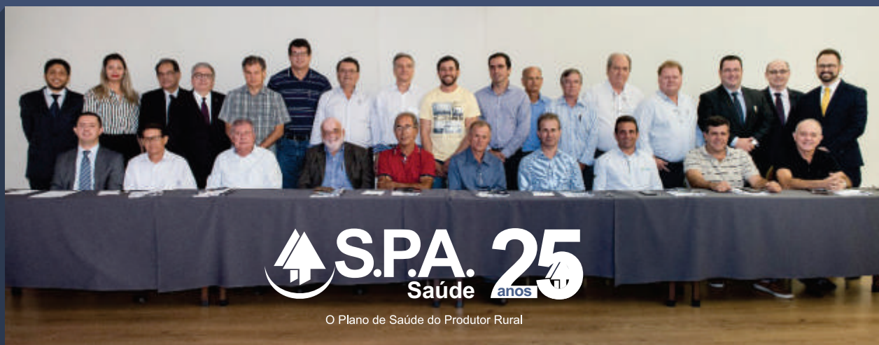
Membros dos Conselhos Diretor e Fiscal, presidentes e diretores de associadas prestigiaram a assembleia