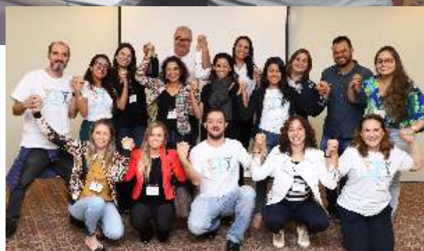
Profissionais de comunicação de várias associadas unem-se num só desafio: buscar o crescimento de vidas em nossos planos de saúde

A participação de todos ultrapassou as expectativas diante da parceria e projetos de novas alternativas de comunicação, em especial no compromisso de divulgar cada vez mais o benefício em suas entidades. A Diretoria do S.P.A. Saúde agradece aos profissionais participantes e, em especial, aos dirigentes das associadas pela liberação e engajamento na comunicação com seus filiados.